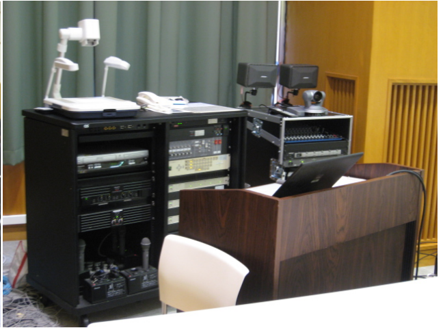
会場風景(M1, 2 講義室):