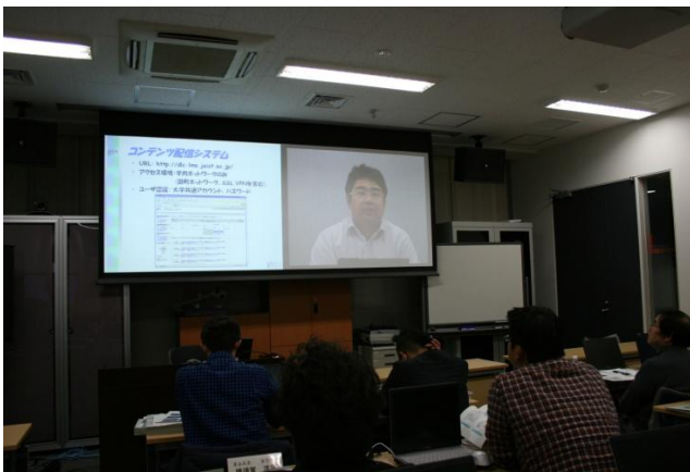
図 3. 田町側の映像(教室前方)