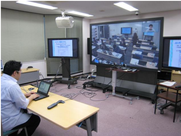
図 1. 遠隔教育研究センター