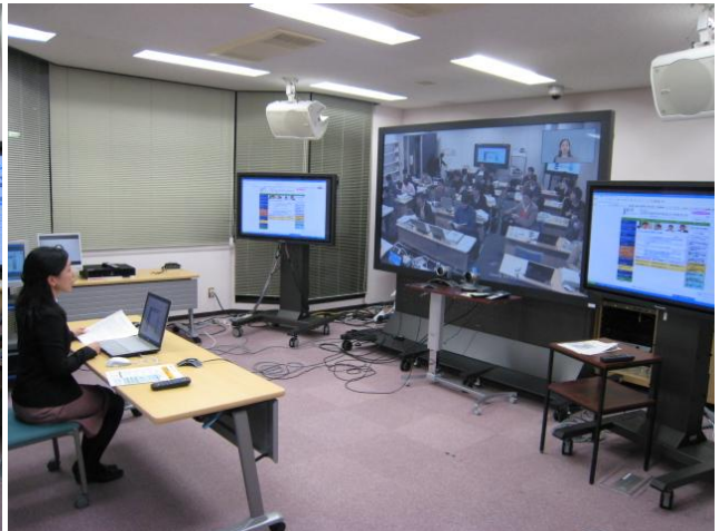
図 2. 図書館からの説明