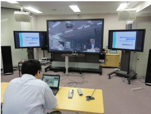
遠隔教育研究ルーム