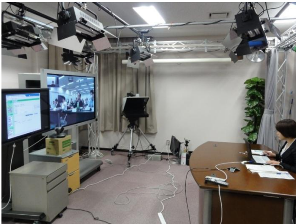
遠隔教育研究スタジオ